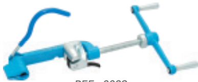
REF : 0029