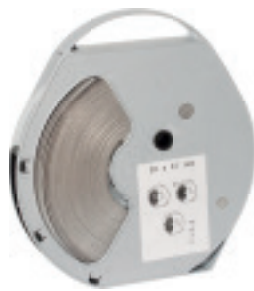
Feuillard largeur 20 mm SB20x