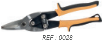
REF : 0028