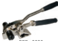
REF : 0030