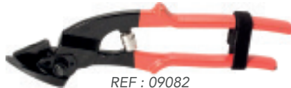
REF : 09082