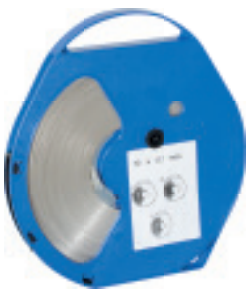
Feuillard largeur 10 mm SB10x