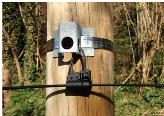
Mise en œuvre d'une pince de suspension Set-up using a suspension clamp